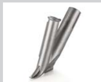
Schnellschweißdüse *, schmaler Luftschlitz, Ø: 3 mm 4 mm 5 mm Art.-Nr.: 105.431 105.432 105.433