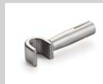
Siebreflektor (Ø 8.25 mm) *, 10 x 12 mm Artikel-Nr.: 107.324

* Aufschiebbar auf Düsen mit Ø 5 mm: 107.144 105.567 107.154 107.006