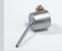
Soldering nozzle Ø 2 mm Article No: 107.146