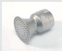
Sieve reflector Ø 65 mm Article No: 106.127