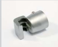
Soldering reflector 17 x 34 mm Article No: 107.325