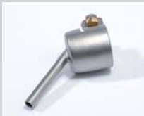
Lötdüse Ø 4 mm Artikel-Nr.: 107.151