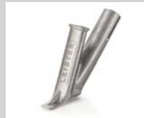
Speed welding nozzle *, triangular shaped, 5.7 mm 7 mm Article No: 106.992 106.993