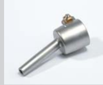
Tubular nozzle Ø 5 mm Article No: 107.144