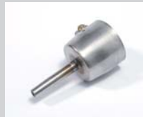
Tubular nozzle Ø 5 mm Article No: 107.154