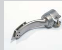
Bügeldüse 15 x 25 mm Artikel-Nr.: 107.305