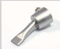
Wide slot nozzle 20 mm Article No: 106.998