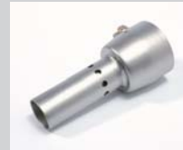
De-horning nozzle Article No: 107.007