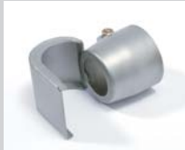
Spoon reflector 25 x 30 mm Article No: 107.313