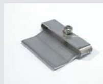
Scraper nozzle, only with heater tube, Article-No: 116.053 Article No: 116.054