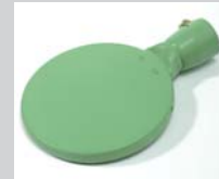
Welding mirror 135 mm, PTFE coated Article No: 107.345