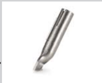
Tacking nozzle * Article No: 106.996