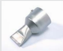
Tape welding nozzle 40 mm Article No: 107.134