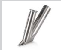
Schnellschweißdüse * Ø: 3 mm 4 mm 5 mm Art.-Nr. 106.989 106.990 106.991