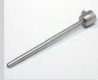
Verlängerungsdüse Ø 5 x 150 mm, gerade Artikel-Nr.: 105.567