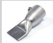
Wide slot nozzle 40 mm Article No: 106.999