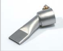
Wide slot nozzle 20 mm Article No: 107.142