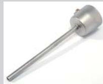
Verlängerungsdüse Ø 5 x 130 mm, gerade Artikel-Nr.: 107.006