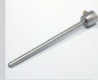
Extension nozzle Ø 5 x 150 mm, straight Article No: 105.567