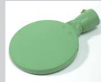
Schweisspiegel 135 mm, PTFE-beschichtet Artikel-Nr.: 107.345