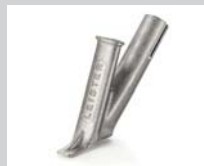
Schnellschweißdüse *, Dreiecksprofil 5.7 mm 7 mm Artikel-Nr.: 106.992 106.993