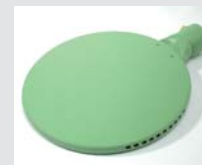
Welding mirror 270 mm, PTFE coated Article No: 107.346