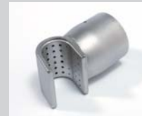
Sieve reflector 35 x 20 mm Article No: 107.309