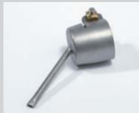
Lötdüse Ø 3 x 1.5 mm, oval Artikel-Nr.: 107.148