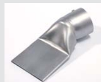
Wide slot nozzle 75 x 2 mm, delivered with stand, Article-No: 116.753 Article No: 107.266