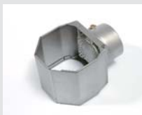
Folding reflector 60 x 75 mm Article No: 107.328