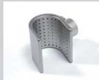
Siebreflektor 50 x 35 mm Artikel-Nr.: 107.311