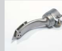
Ironing nozzle 15 x 25 mm Article No: 107.305