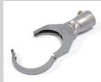
Klappreflektor 70 x 12 mm Artikel-Nr.: 107.315