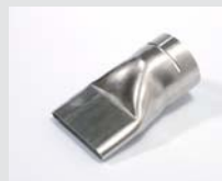
Wide slot nozzle 70 x 10 mm Article No: 107.258