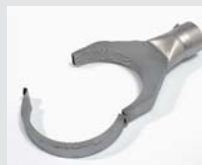
Folding reflector 125 x 22 mm Article No: 107.330