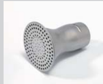
Sieve reflector Ø 65 mm Article No: 107.319