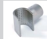
Sieve reflector 50 x 35 mm Article No: 107.308