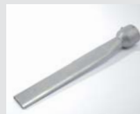
Wide slot nozzle 45 x 12 x 350 mm Article No: 105.961