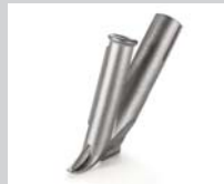
Speed welding nozzle *, with small air-slide, Ø: 3 mm 4 mm 5 mm Art. No.: 105.431 105.432 105.433