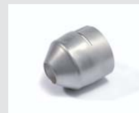
Round nozzle 20 mm Article No: 107.229