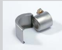
Löffelreflektor 25 x 30 mm Artikel-Nr.: 107.312