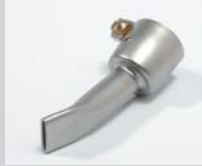
Wide slot nozzle 15 mm Article No: 107.141