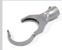
Folding reflector 70 x 12 mm Article No: 107.315