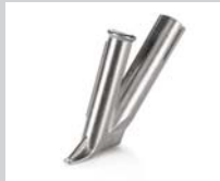
Speed welding nozzle * Ø: 3 mm 4 mm 5 mm Art. No.: 106.989 106.990 106.991