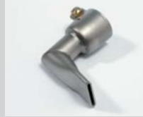
Angled nozzle 20 mm, 90° angled Article No: 105.556