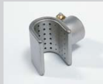
Siebreflektor 20 x 35 mm Artikel-Nr.: 107.310