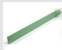
Heizschwanz 74 x 12 x 520 mm, Kanten gerundet, PTFE-beschichtet Artikel-Nr.: 107.347