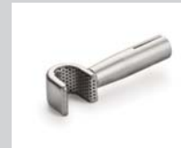
Sieve reflector (Ø 8.25 mm) *, 10 x 12 mm Article No: 107.324

* use in combination with Ø 5 mm: 107.144 105.567 107.154 107.006