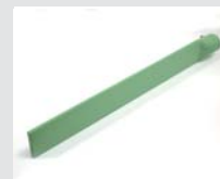
Swordshaped nozzle 74 x 12 x 520 mm, edges rounded, PTFE coated Article No: 107.347