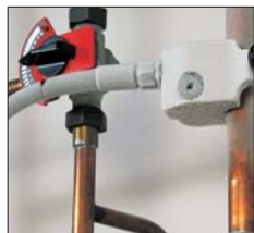
Простая система крепления клеммы с вкладышами

Можно использовать на параллельных трубах и в труднодоступных местах